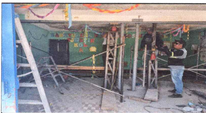
Foto 4: MANTENIMIENTO E INSTALACIÓN DE COLUMNAS Y VIGAS DE ESTRUCTURA METALICA A LA VIGA DE CONCRETO EXISTENTE