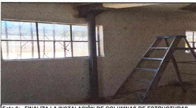
Foto 6: FINALIZA LA INSTALACIÓN DE COLUMNAS DE ESTRUCTURAS METÁLICAS.

Observación: Si es necesario se pueden agregar hojas adicionales y actualizar el número de hojas.