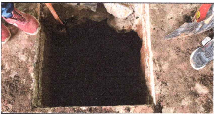
Foto 3: ESCABACIÓN DE AGUJERO PARA LA INSTALACIÓN DE PILOTOS DE SIMENTACIÓN PARA COLUMNAS EN LAS PAREDES.