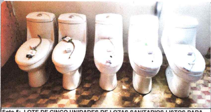
Foto 5: LOTE DE CINCO UNIDADES DE LOZAS SANITARIOS LISTOS PARA INSTALACION.