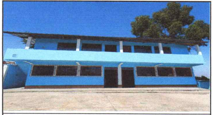
Suministro instalación Cimentación , Suministro e instalación de techo paneles