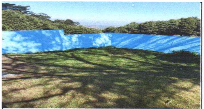
Suministro instalación Cimentación

Observación: Si es necesario se pueden agregar hojas adicionales y actualizar el número de hojas.