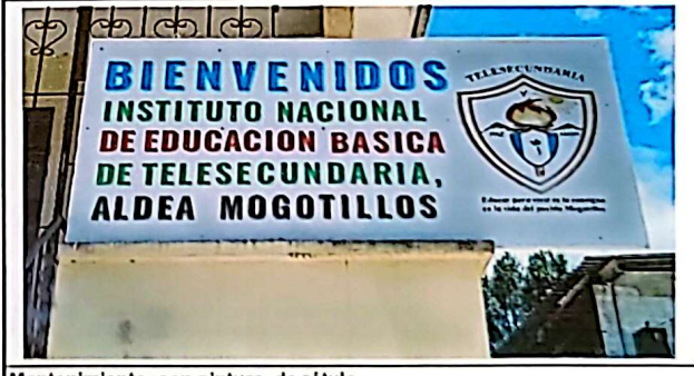
Mantenimiento, con pintura, de rótulo

Observación: Si es necesario se pueden agregar hojas adicionales, actualizar el número de hojas.