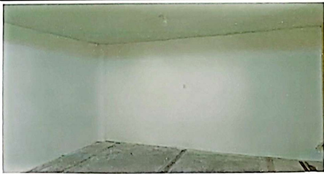
Sustitución de repello en muros.