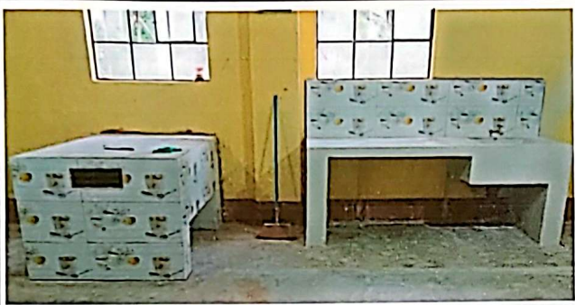
Reparación de estufa de leña con chimenea. Sustitución de plancha para estufa de leña. Reparación de mesón de cocina.