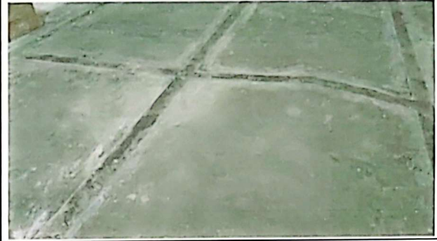
Reparación de piso de concreto.