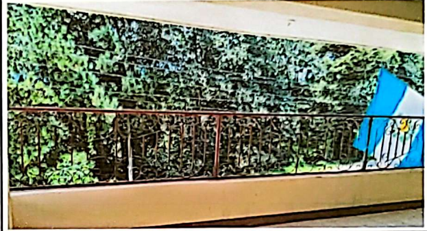
Sustitución de baranda de metal.