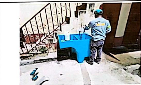
Instalación de pila de un ala.