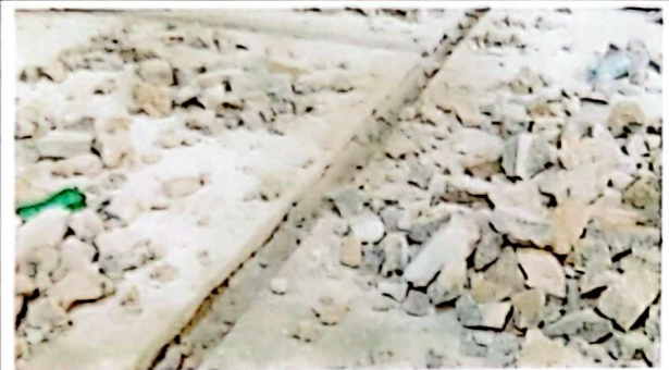
Reparación de piso de concreto.