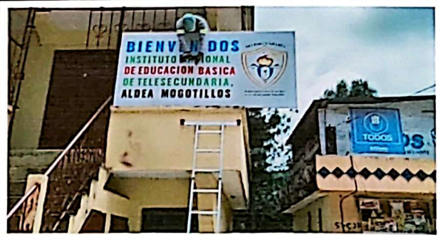
Mantenimiento, con pintura, de rótulo

Observación: Si es necesario se pueden agregar hojas adicionales y actualizar el número de hojas.