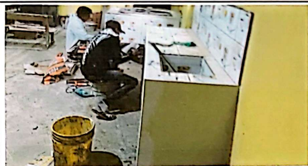
Reparación de estufa de leña con chimenea. Sustitución de plancha para estufa de leña. Reparación de mesón de cocina.