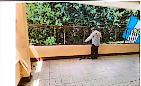
Sustitución de baranda de metal.