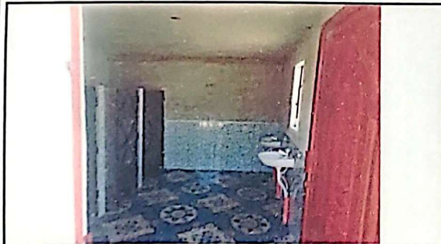
Sustitución de lavamanos