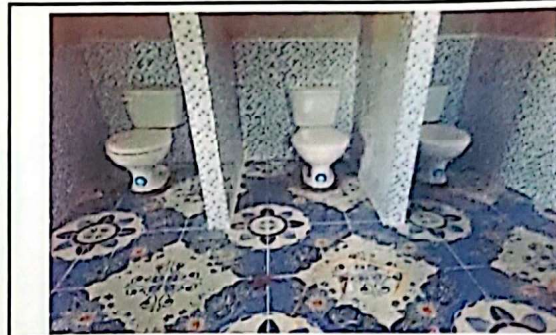
Sustitución de inodoros elongados