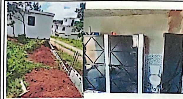
Mantenimiento a modulo de servicios sanitarios