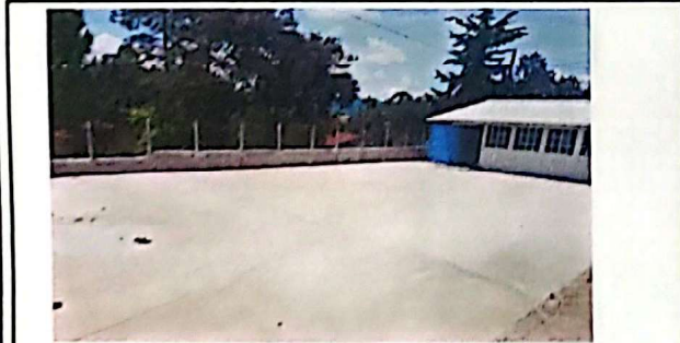
torta de cemento frente a los baños