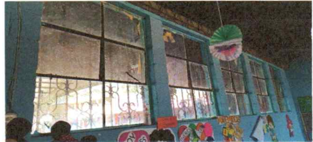
Reparación y sustitución de ventanas