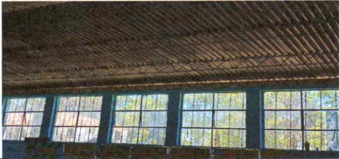
Mantenimiento a estructura a soporte de metal con anticorrosivo