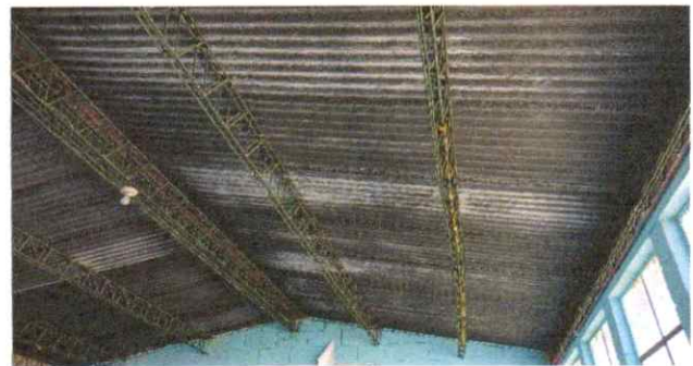
sustitución de lámina, por lamina troquelada calibre 26