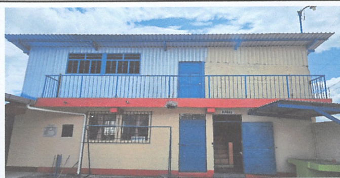
Sustitución a barandas de metal en pasillos

Observación: Si es necesario se pueden agregar hojas adicionales y actualizar el número de hojas.