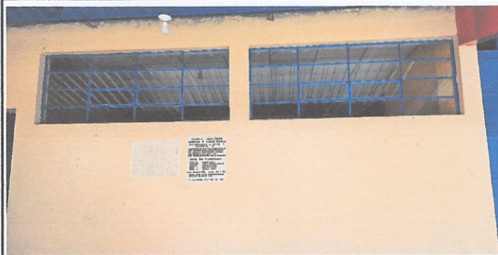
Sustitución de vidrios 5mm