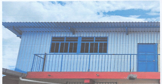
Sustitución de ventanas