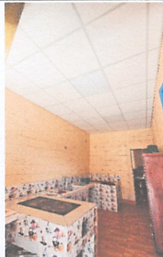
Suministro e instalación de cielo falso reticulado de fibra mineral