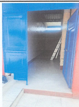
Sustitución de piso en bodega