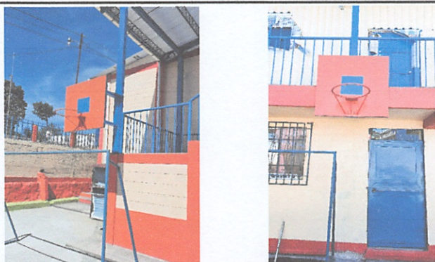
Sustitución de tableros de basquet bol