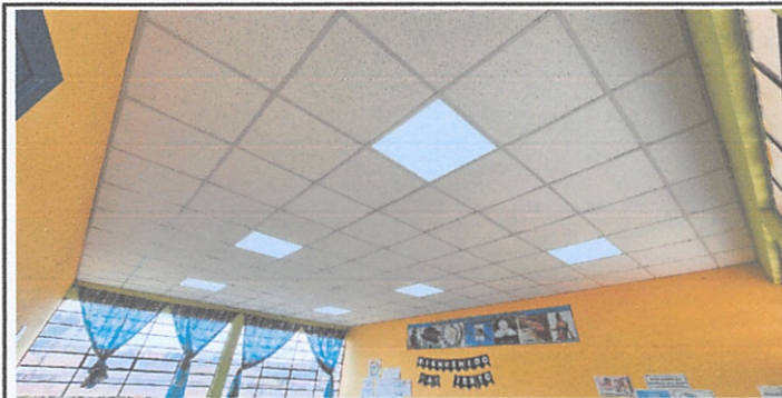
Suministro e instalación de cielo falso reticulado de fibra mineral