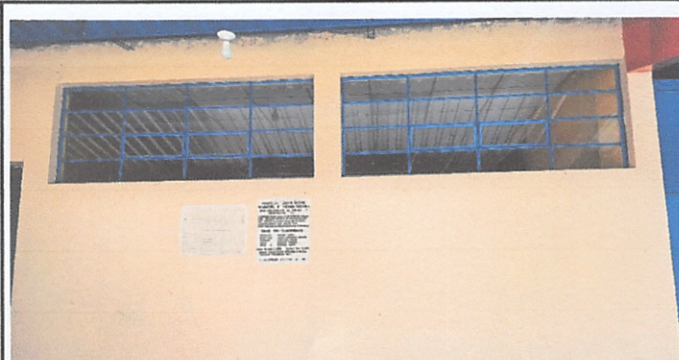
Mantenimiento a estructura de metal de ventana