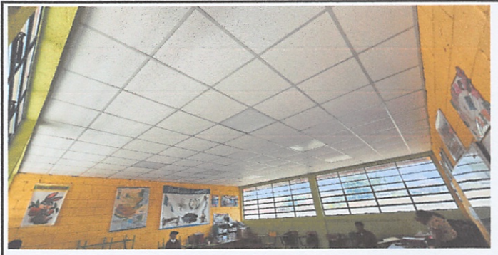
Suministro e instalación de cielo falso reticulado de fibra mineral

Observación: Si es necesario se pueden agregar hojas adicionales y actualizar el número de hojas.