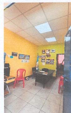
Suministro e instalación de cielo falso reticulado de fibra mineral