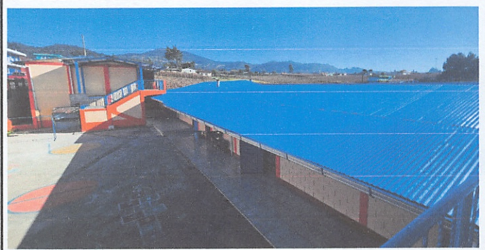
Mantenimiento de cubierta de lámina con pintura anticorrosiva