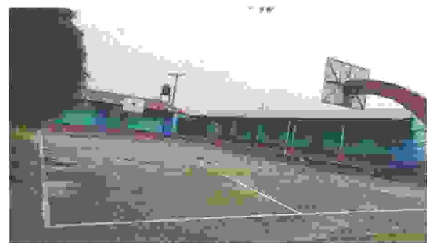
Suministro e instalación de techo metalico para cancha polideportiva