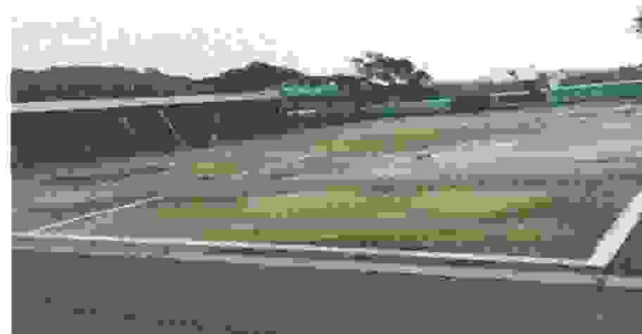
Suministro e instalación de techo metalico para cancha polideportiva