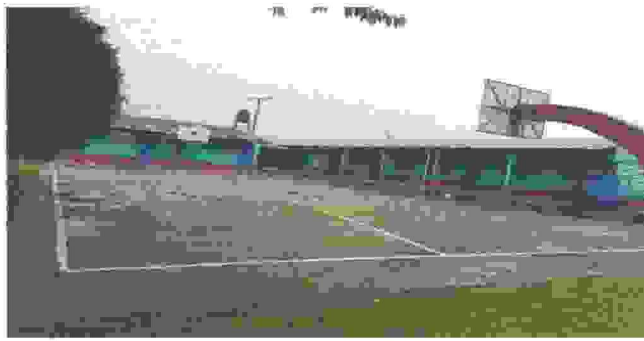
Suministro e instalación de techo metalico para cancha polideportiva