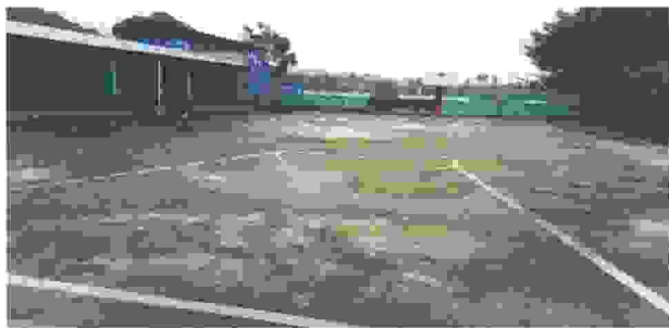
Suministro e instalación de techo metalico para cancha polideportiva