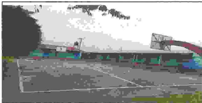
Suministro e instalación de techo metalico para cancha polideportiva