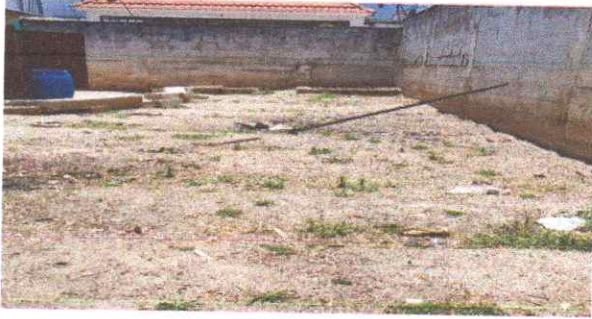
Reparacion y mantenimiento de baños