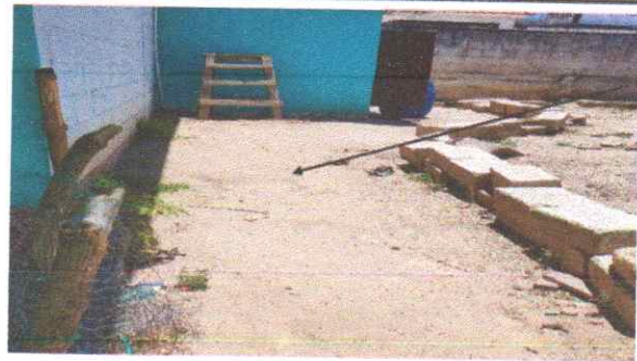
Instalacion de Torta de cemento frente de los baños