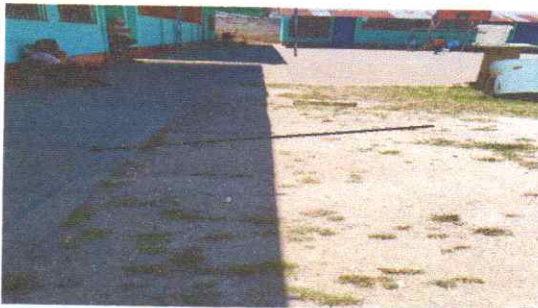
Reparacion de torta de cemento frente al edificio de parvulos