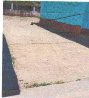
Instalacion de torta de cemento entre edificios