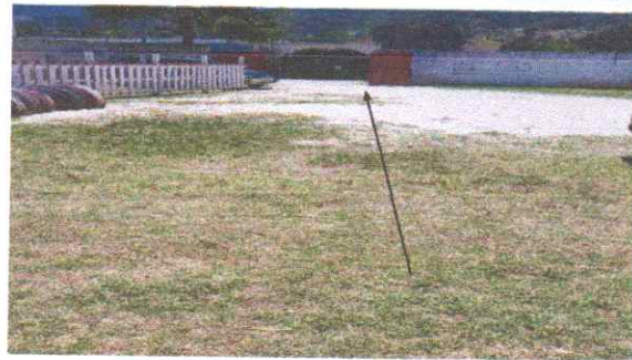
Instalacion de carrileras de entrada con torta de cemento