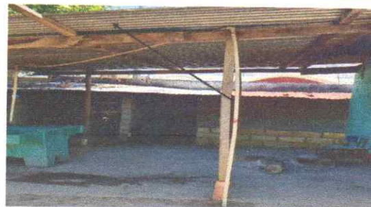
Sustitucion de lamina troquelada calibre 26

Observación: Si es necesario se pueden agregar fotos adicionales, en la parte posterior de hojas.