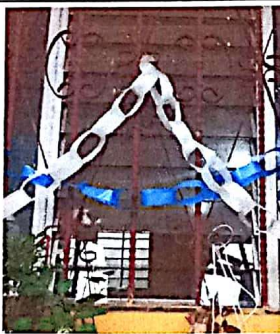
Sustitución de vidrios 5mm