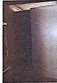
Sustitución de puerta de servicios sanitarios