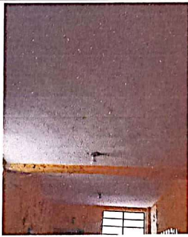
Suministro y aplicación de impermeabilizante de losa Agua Aqualock 10 años