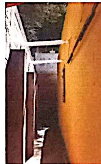
Sustitución de bajada de agua pluvial

Observación: Si es necesario se pueden agregar hojas adicionales y actualizar el número de la observación.