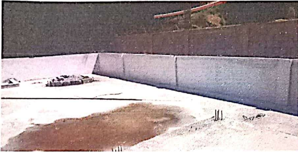
Sustitución muro de contención