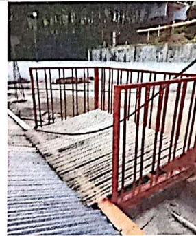
Sustitución de estructura de metal de ventana