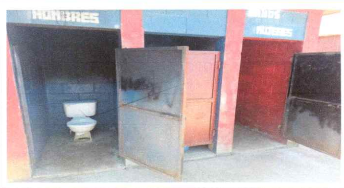
Pintura de paredes y puertas de los baños