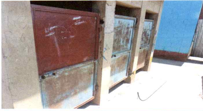
Pintura y cambio de una puerta de metal