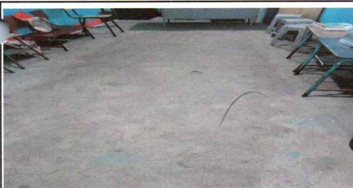
Sustitucion de piso Ceramico en la Direccion del Instituto