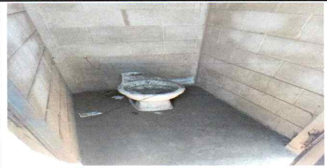
Sustitucion de 5 de tazas de sanitario