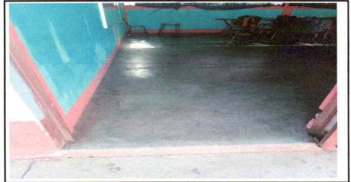
Sustitución de piso Ceramico en tres aulas del establecimiento

Observación: Si es necesario se pueden agregar hojas adicionales y actualizar el número de hojas.