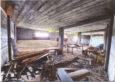
Mantenimiento de muros y losa con repello e impermeabilización,