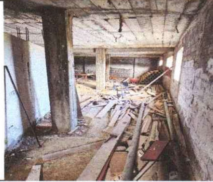
Mantenimiento de muros y losa con repello e impermeabilización,