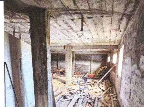
Sustitución de piso cerámico