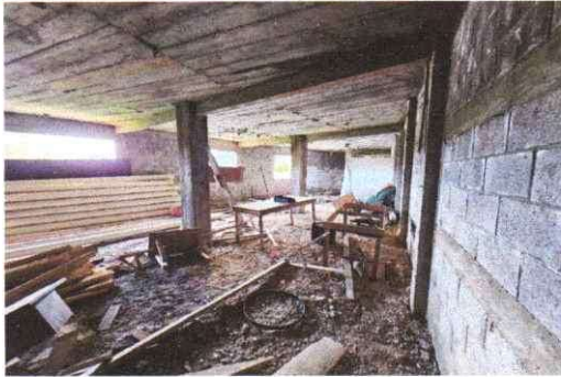
Sustitución de piso cerámico