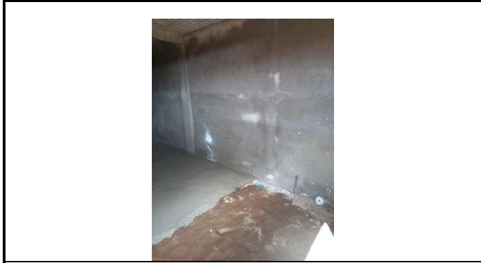
losa y pintura