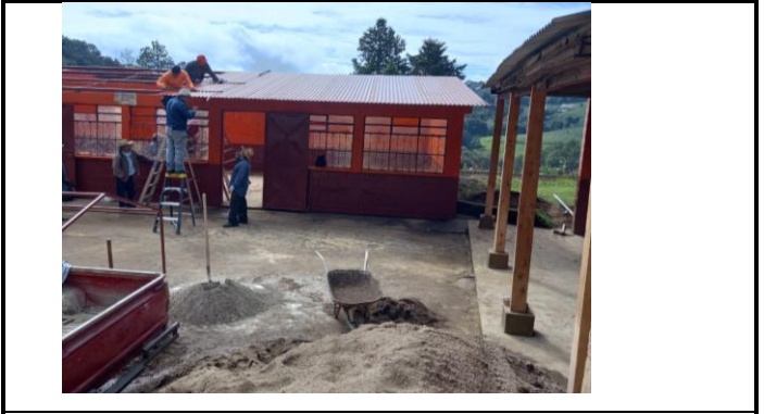
Ventanas y puertas