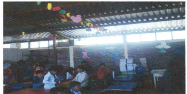
Mantenimiento del sistema eléctrico