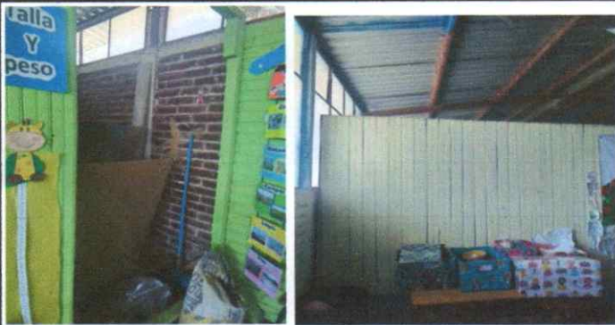
Sustitución del muro prefabricado