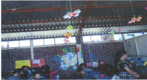
Sustitución de estructura metálica