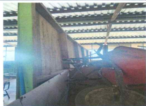
Sustitución del muro prefabricado

Observación: Si es necesario se pueden agregar hojas adicionales y actualizar el número de hojas.