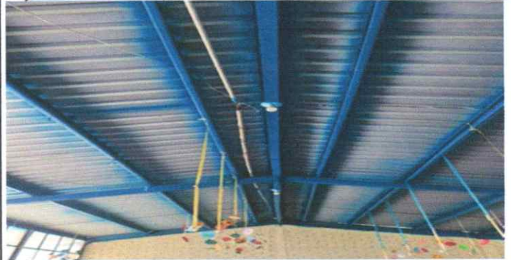
Mantenimiento del sistema eléctrico