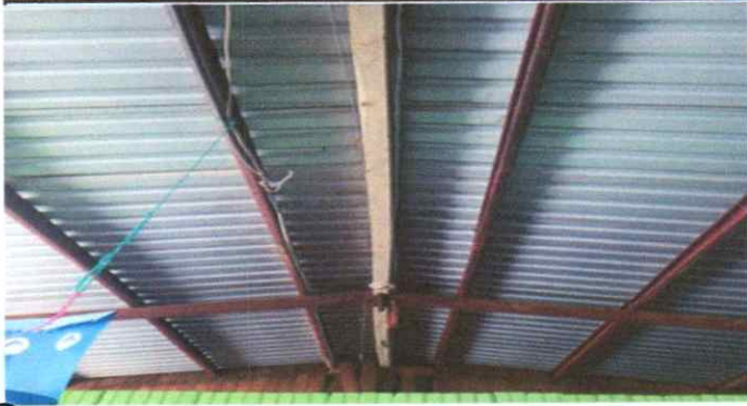
Sustitución de estructura metálica