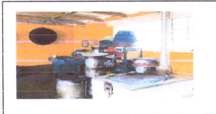
Mantenimiento de cocina