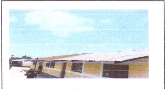
Sustitucion de lamina troquelada calibre 26

Observación: Si es necesario se pueden agregar hojas adicionales y actualizar el número de hojas.