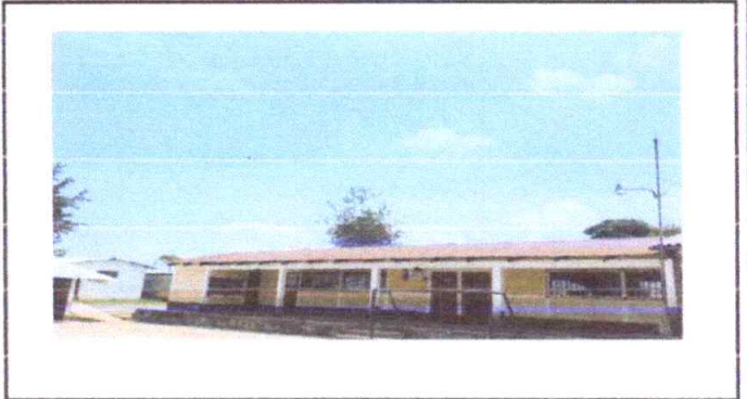
Sustitucion de lamina troquelada calibre 26