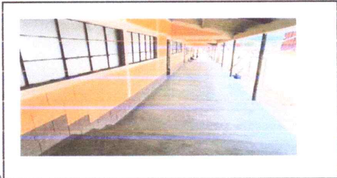
Suministro y aplicación de pintura en muros