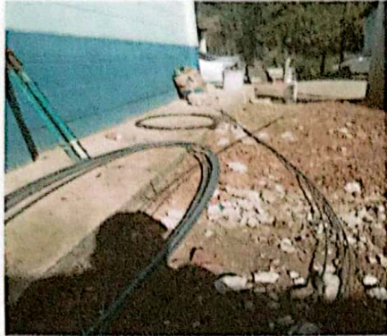
Foto1: estado del avance del area del almacen.