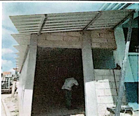
Foto 5: entechado del almacen y colocación de puerta e instalación eléctrica.