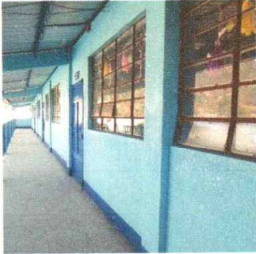
Foto1: PINTURA EN MUROS