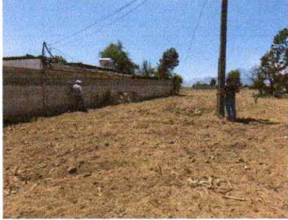
Foto 1: Medición y verificación del suelo en el área específica para proyecto de entechado.