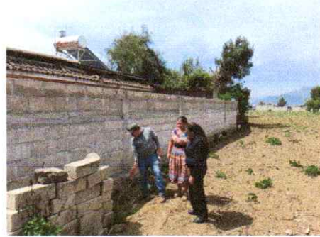
Foto 2: Verificación para inicios de trabajo de función y colocación de estructura metálica.