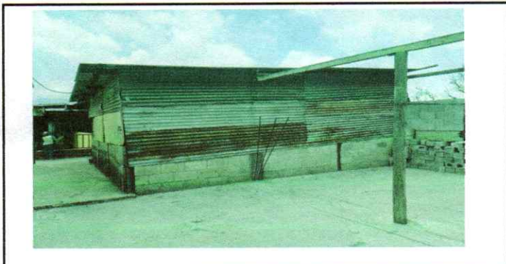
Sustitución de techo