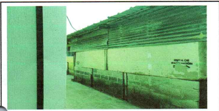
Sustitución de repello, Sustitución de ventanas