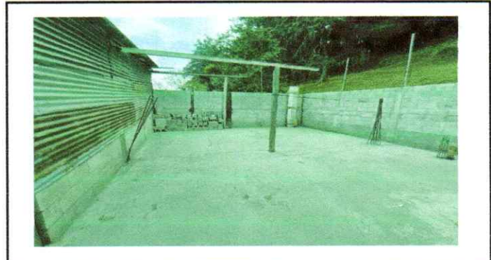
Sustitución de repello

Observación: Si es necesario se pueden agregar hojas adicionales y actualizar el número de hojas.