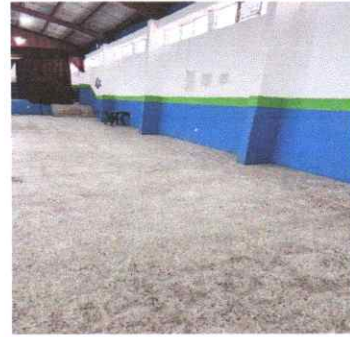
Mantenimiento de planchas de concreto de cancha polideportiva