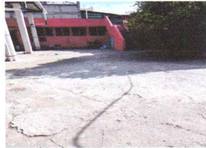
Sustitucion de piso

Observación: Si es necesario se pueden agregar hojas adicionales y actualizar el número de hojas.