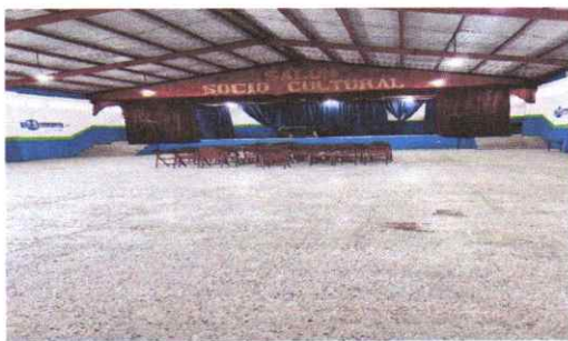
Mantenimiento de planchas de concreto de cancha polideportiva