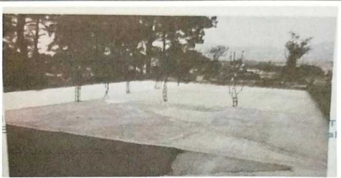
Foto 2: Suministro y Aplicación de impermeabilizante en área de losa en mal estado.