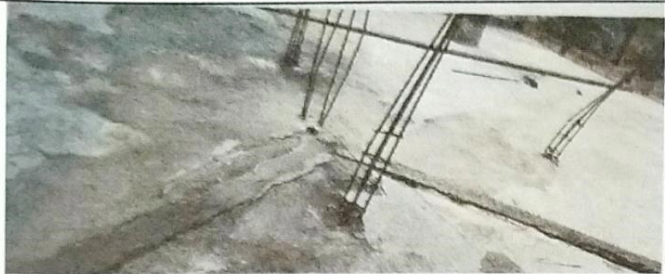
Foto 1: Direccionamiento de pañuelos hacia bajada de aguas pluviales. De lo anterior se reitera el compromiso de terminar los trabajos en la fecha indicada.