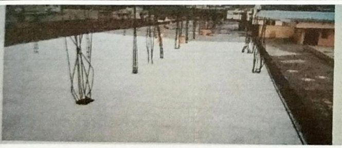
Foto 5: Se aplicó la capa de impermeabilizante según se secaba el área para garantizar la adherencia adecuada.