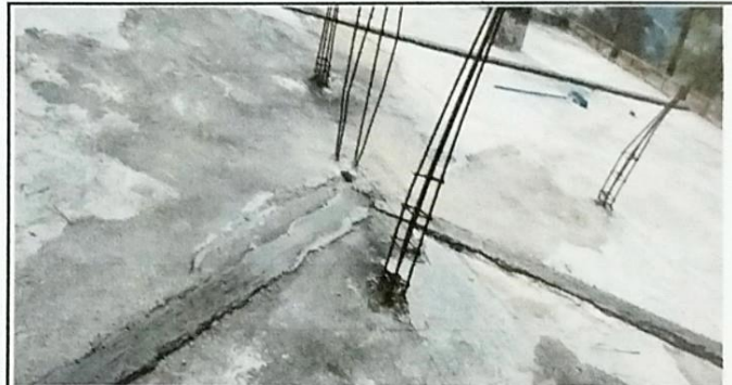
Foto 4: Direccionamiento de pañuelos hacia bajada de aguas pluviales.