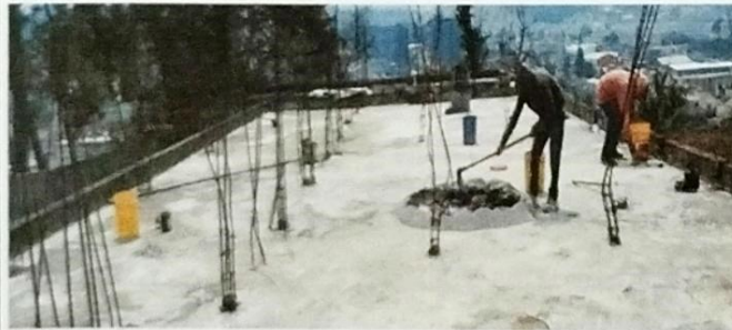
Foto 5: Colocación de sello en grietas usando aditivo de unión y sello de grietas en áreas requeridas.