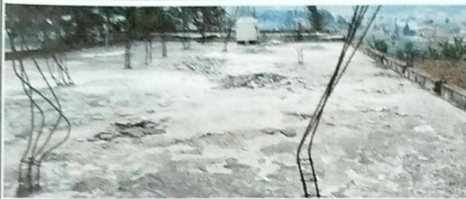
Foto 1: Vista del inicio de los trabajos limpieza en área de losa.