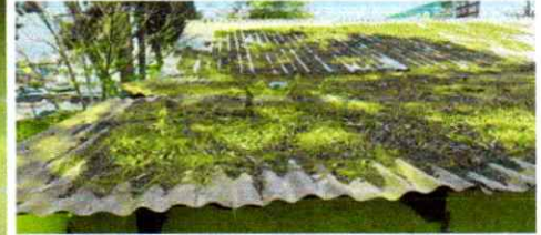
Sustitucion de Estructura Portante de techo madera por metal en salon Aula, Sustitucion de canal y bajadas de agua pluvial por canal americano calibre 26