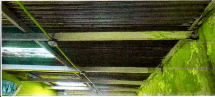
Sustitucion de Estructura Portante de techo madera por metal en salon Aula, Sustitucion de canal y bajadas de agua pluvial por canal americano calibre 26