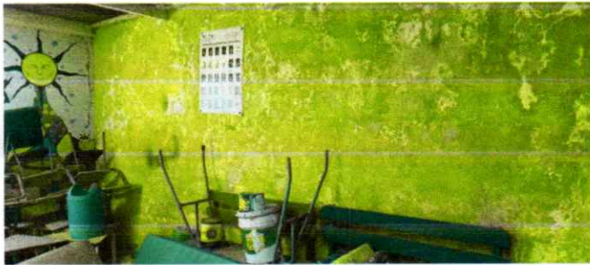
Sustitucion de Lamina por Lamina Troquelada Calibre 26