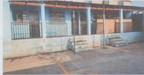
mantenimiento de herrería (puertas, estructuras metalicas, balcones, mantenimiento de bodega)

Observación: Si es necesario se pueden agregar hojas adicionales y actualizar el número de hojas.