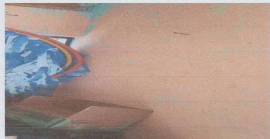
mantenimiento de bodega