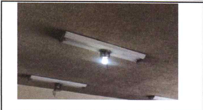
Mantenimiento del sistema electrico general