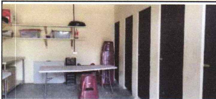
Suministro e instalacion de lavaplatos para laboratorio de emprendimiento para la productividad