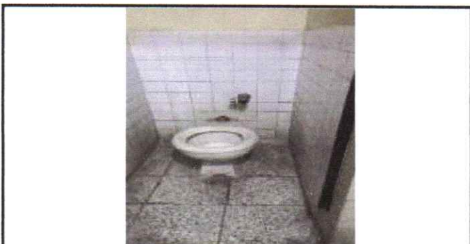
Mantenimiento de servicios sanitarios (inodoros y mingitorio)

Observación: Si es necesario se pueden agregar hojas adicionales y actualizar el número de hojas.