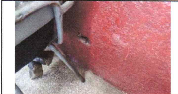
Mantenimiento del sistema electrico general