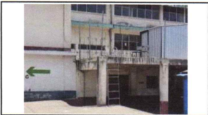
Sustitucion de modulo de gradas de metal con pasamanos