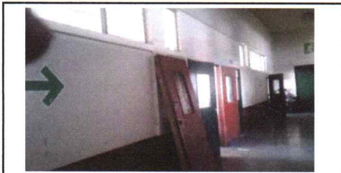
Sustitucion de puertas