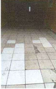
Sustitución de piso ceramico