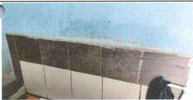
Sustitución de azulejo