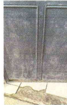
Sustitución de puerta metalica