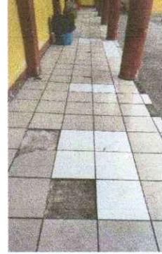
Sustitución de piso ceramico