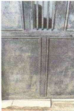
Sustitución de puerta metalica