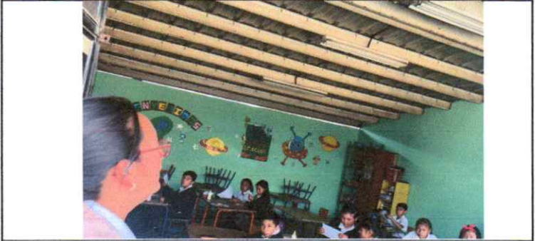
Suministro e instalacion de ventiladores de techo