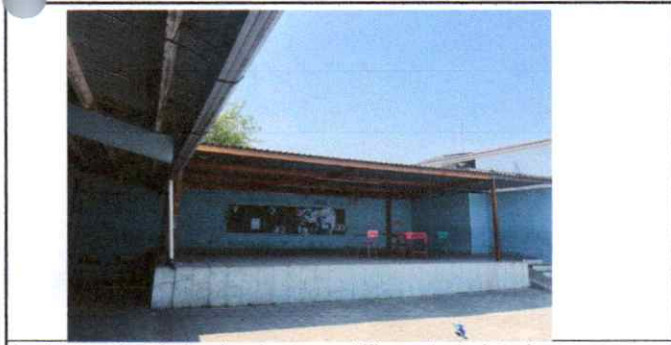
Suministro e instalacion de estructura metálica portante de techo