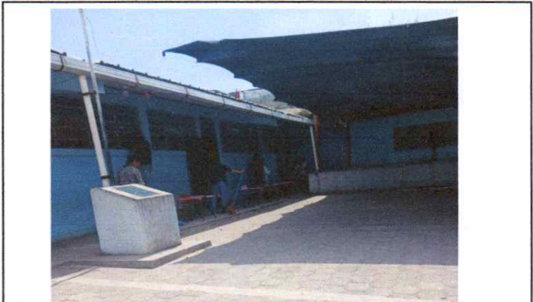
Suministro e instalacion de estructura metálica portante de techo y lamina troquelada

Observación: Si es necesario se pueden agregar hojas adicionales y actualizar el número de hojas.