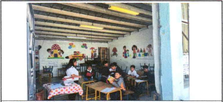
Suministro e instalacion de ventiladores de techo