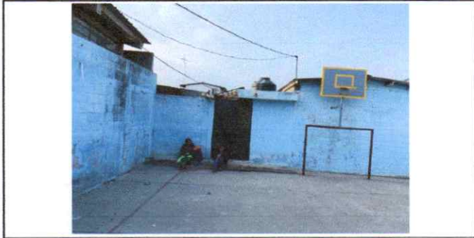
Suministro e instalación de depósitos de agua