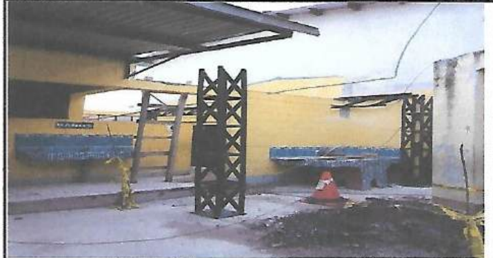
Foto 2: PREPARANDO LA LAPLATAFORMA DONDE ESTARA LA CONSTRUCCIÓN DE LA COCINA