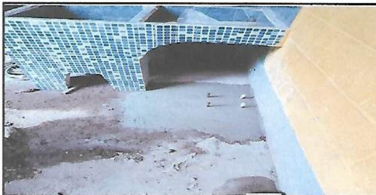
Foto 3: COLOCANDO LOS PINES PARA LAS JOIST PARA LA BASE DE LA COCINA