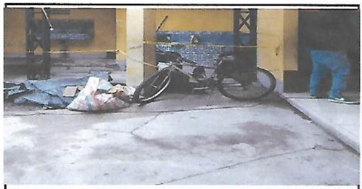
Foto 4: COLOCANDO ESTRUCTURA DE JOIST EL SOPORTE Y SEGURIDAD DE LA COCINA