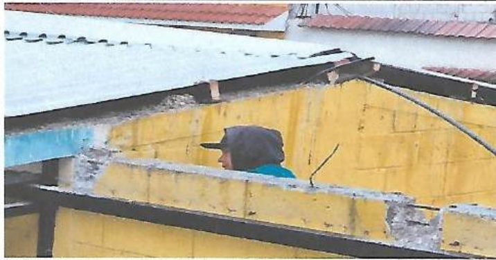
Foto1: REPARANDO PAREDES PARA REMOZAMIENTO DE COCINA