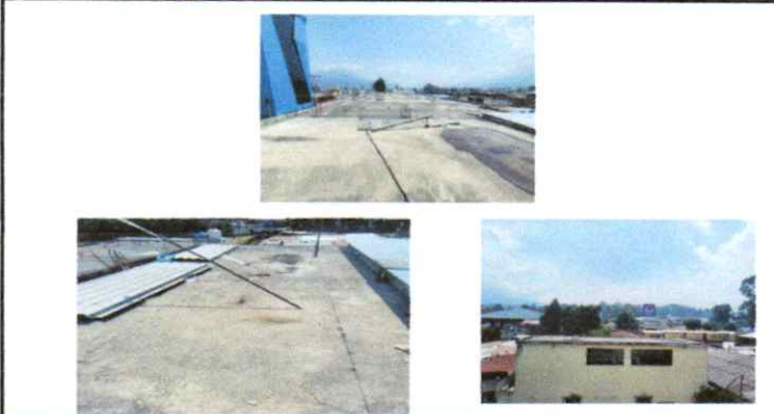
Pañuelos e impermeabilización de terraza