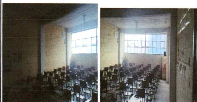
Reparación de muros con repello

Observación: Si es necesario se pueden agregar hojas adicionales y actualizar el número de hojas.