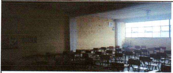
Reparación de muros con repello , Reparación de deposito de agua (2500lt)