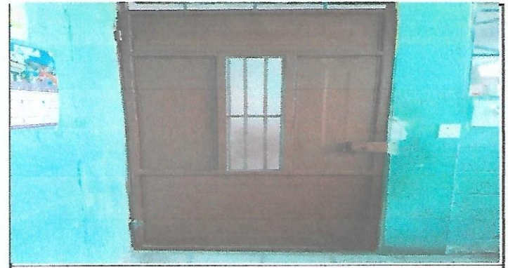
Finalización de sustitución de puerta-