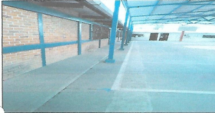
Finalización de introducción de tubería de aguas pluviales.