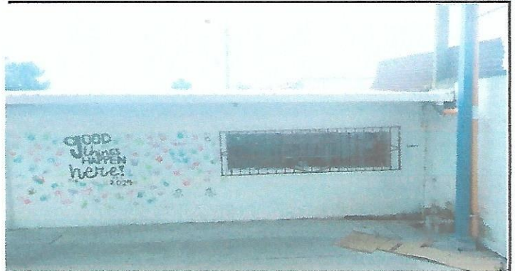
Finalización del trabajo de cambio de lámina por lámina troquelada color gris