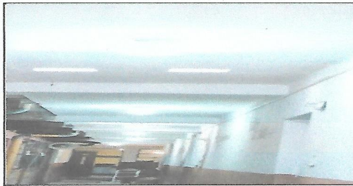
Finalización de iluminación de pasillo.