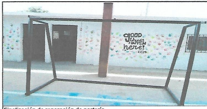
Finalización de reparación de portería.