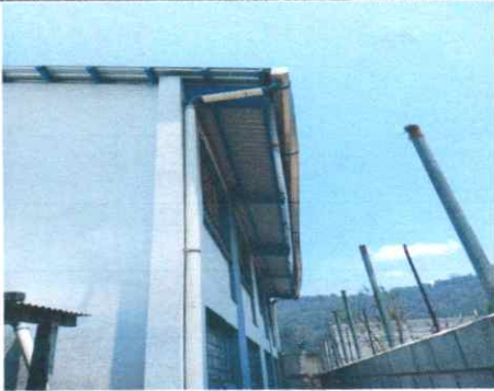
Reparación de canal de metal