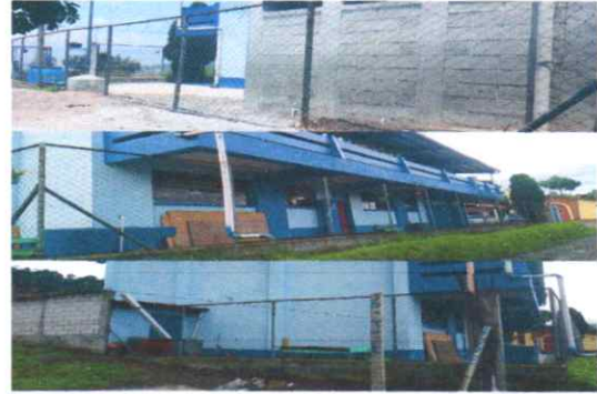
Sustitución de muro perimetral con barda prefabricada de concreto