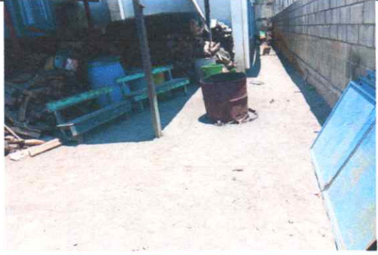
Sustitución de piso de torta de concreto