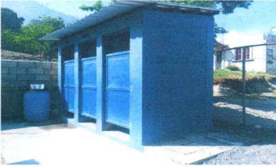
Mantenimiento de fosa Septica