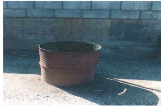
Sustitución de basurero incinerador

Observación: Si es necesario se pueden agregar hojas adicionales y actualizar el número de hojas.