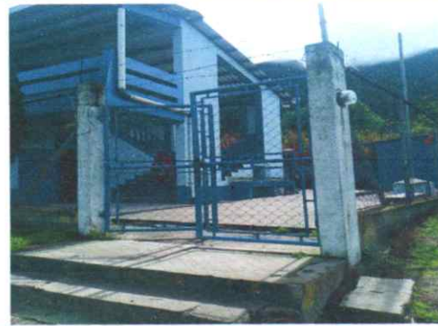
Sustitución de Portón de metal

Observación: Si es necesario se pueden agregar hojas adicionales y actualizar el número de hojas.