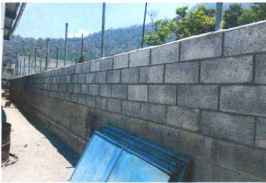
Sustitución de muro de contención