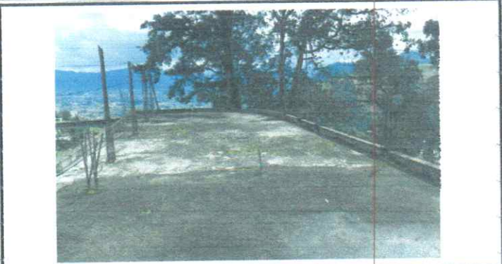
Mantenimiento de losa de concreto