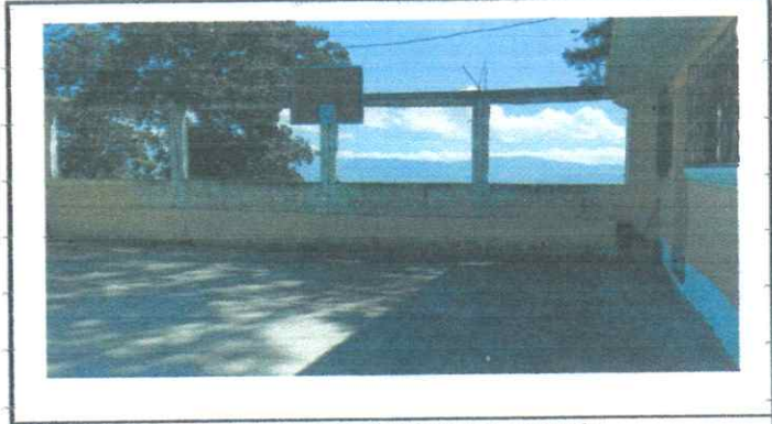
Suministro e instalación de estructura de techo para patio