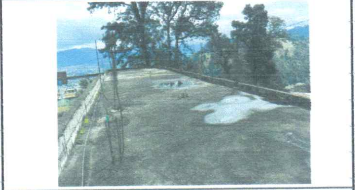
Mantenimiento de losa de concreto