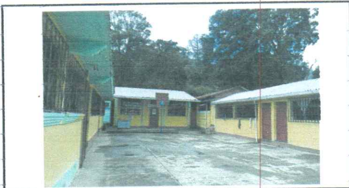
Suministro e instalación de estructura de techo para patio