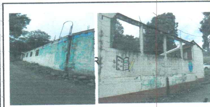
Suministro y aplicación de pintura