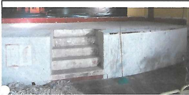
Foto1: Sustitución de azulejo en escenaio salón de usos múltiples