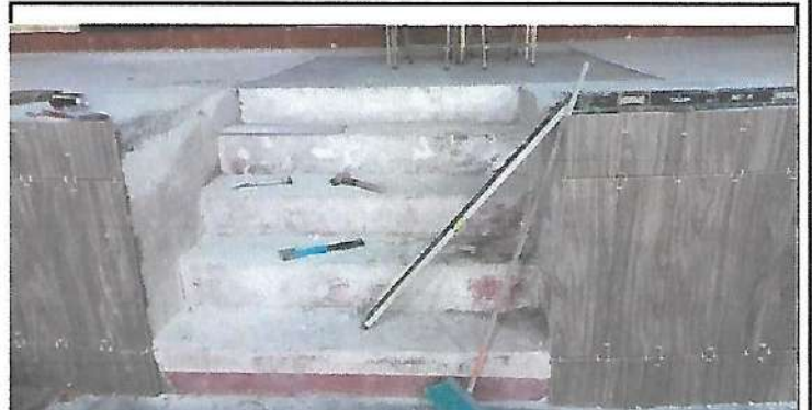
Foto 2: Sustitución de azulejo en escenaio salón de usos múltiples