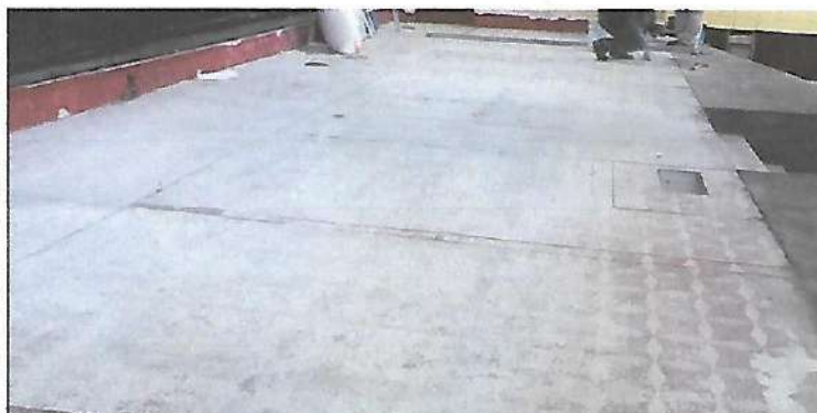
Foto 3: Sustitución de azulejo en escenaio salón de usos múltiples