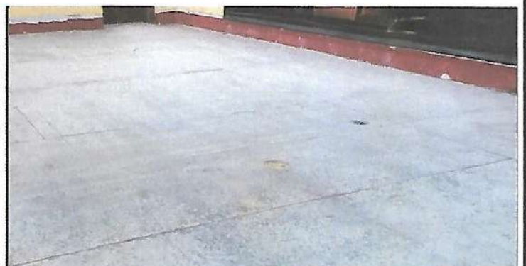
Foto 4: Sustitución de azulejo en escenaio salón de usos múltiples