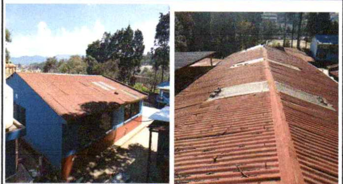
Sustitución de lamina por lamina troquelada calibre 26 ( Aulas de Párvulos, Dirección, Bodega y 4o.grado )