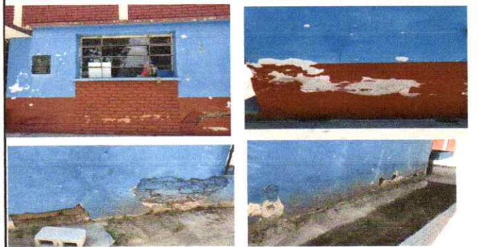
Mantenimiento de paredes de aulas de Parvulos, 4to grado y direccion (repello y cernido)

Observación: Si es necesario se pueden agregar hojas adicionales y actualizar el número de hojas.