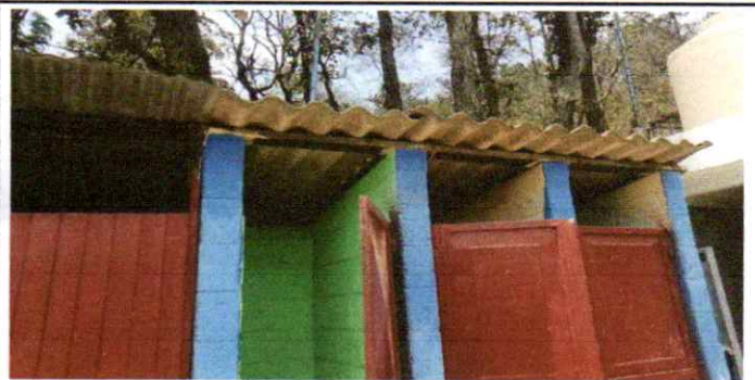
Sustitución de lámina por lámina troquelada calibre 26 ( Baños )