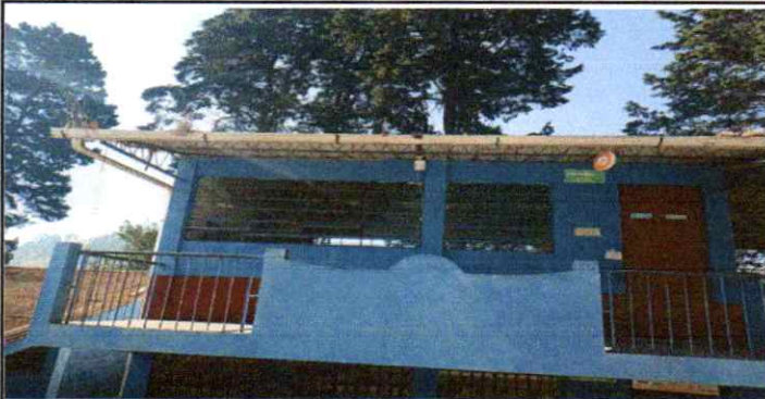
Mantenimiento de canales segundo nivel Aula de 6to grado