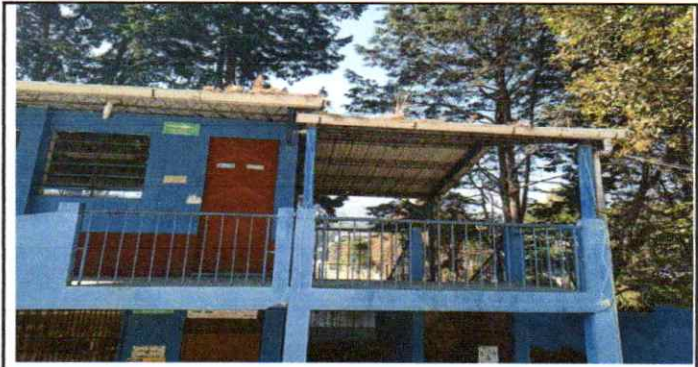
Mantenimiento de canales segundo nivel Aula de 6to grado

Observación: Si es necesario se pueden agregar hojas adicionales y actualizar el número de hojas.