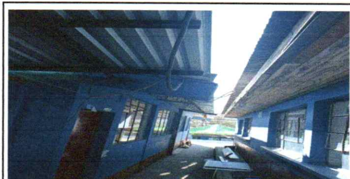
Sustitucion de canales en aulas de párvulos

Observación: Si es necesario se pueden agregar hojas adicionales y actualizar el número de hojas.