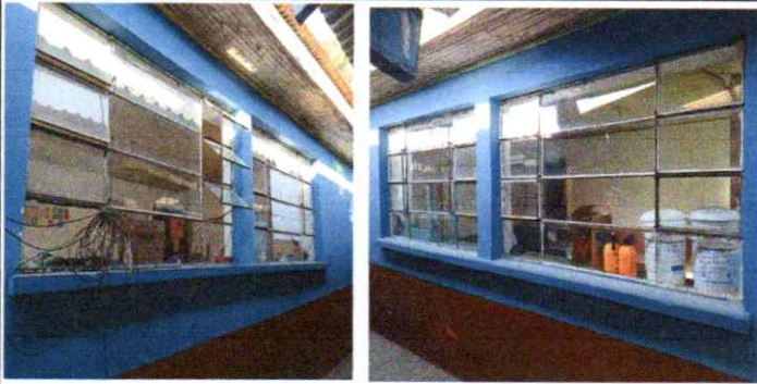
Sustitución de Balcones para ventanas en aulas de párvulos y 4to grado