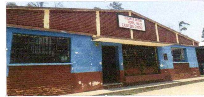
Mantenimiento de paredes de aulas de Parvulos, 4to grado y direccion (repello y cernido)