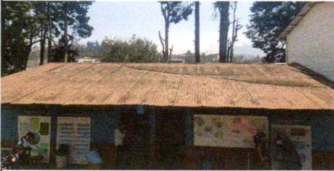
Sustitución de lamina por lamina troquelada calibre 26 ( Aula de 3er grado y 5to.grado )