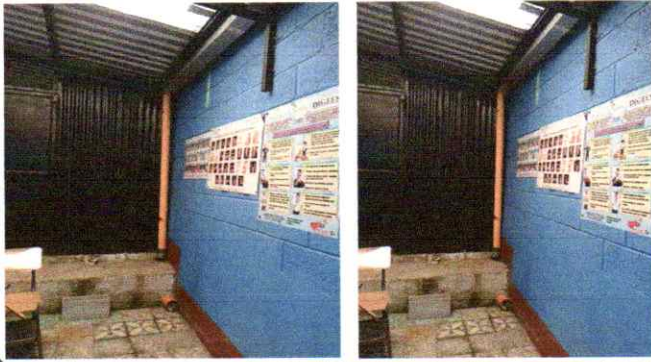
Sustitucion de bajadas de aguas pluviales