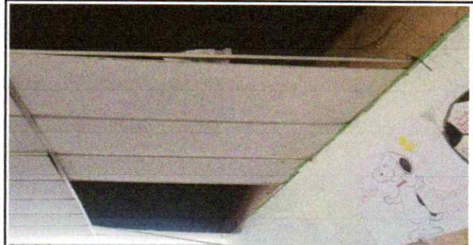
Sustitucion de cielo falso ( Aulas de 3ro y 5to grado)