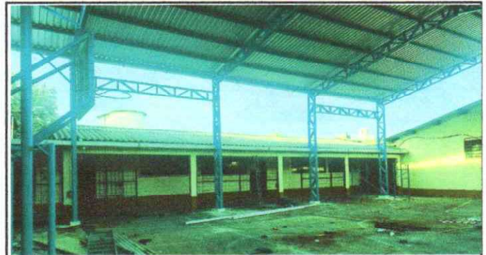
Foto 4: Armado de la estructura metálica aérea y colocación de lámina.