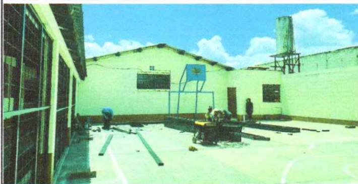
Foto1: Corte y soldadura de perfiles para la estructura metálica. Excavación y fundición de bases.