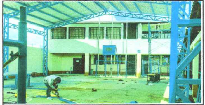
Foto 6: Trabajos finales y de mantenimiento de porteria y canastas

Observación: Si es necesario se pueden agregar hojas adicionales y actualizar el número de hojas.