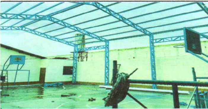
Foto 3: Colocación de estructura metálica que servirá de soporte del techado.