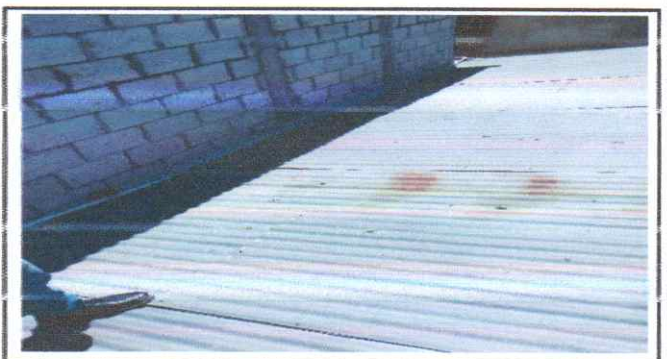
Suministro e instalacion de techo