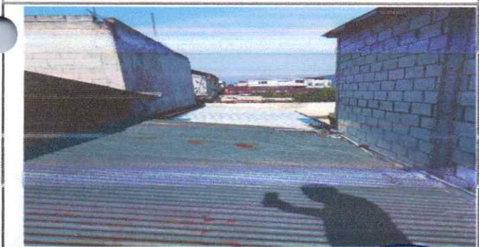
Suministro e instalacion estructura para ampliacion de cocina