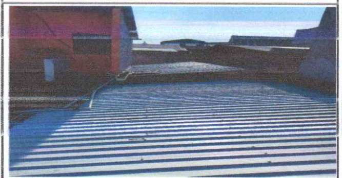
Suministro e instalacion de planchas de prefabricado.