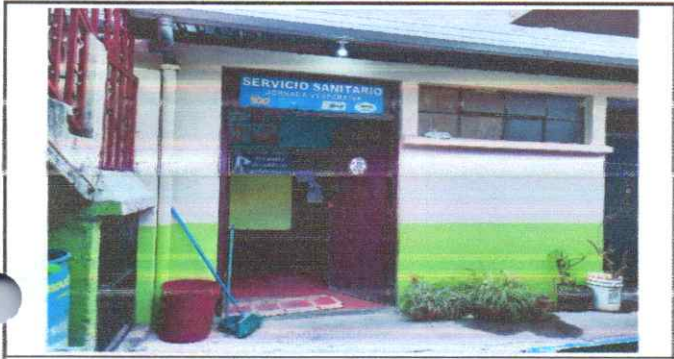
Suministro e instalacion de techo , Suministro e instalacion de entpiso de estructura metalica