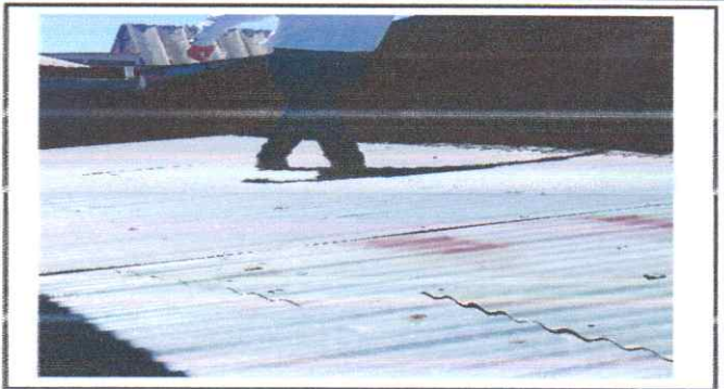
Suministro e instalacion de techo , Suministro e instalacion de entpiso de estructura metalica