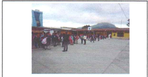
MANTENIMIENTO PINTURA EN MUROS EXTERIORES Aplicación pintura latex para muros exterior