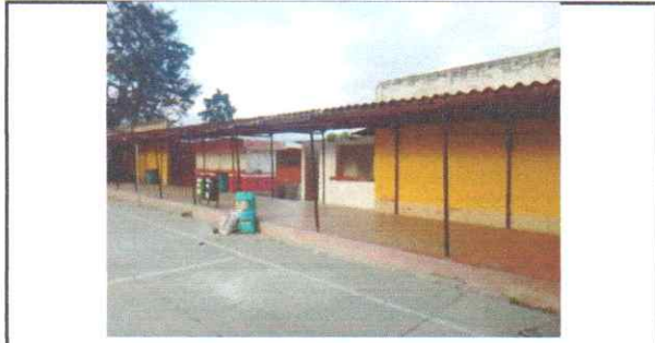
SUSTITUCIÓN DE LAMINA DURALITA POR LAMINA TROQUELADA ALUZINC CALIBRE 26 EN PASILLO