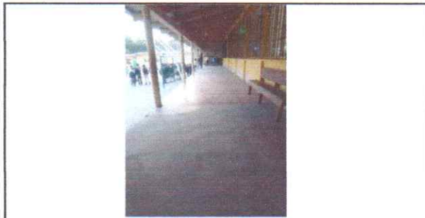
REPARACIÓN/SUSTITUCION/MANTENIMIENTO PISO Sustitución de piso por piso ceramico antideslizante