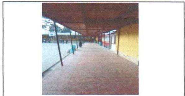
REPARACIÓN/SUSTITUCION/MANTENIMIENTO PISO Mantenimiento de piso antideslizante existente

Observación: Si es necesario se pueden agregar hojas adicionales y actualizar el número de hojas.