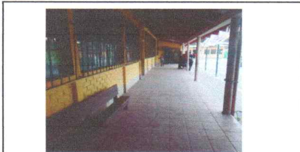
MANTENIMIENTO PINTURA EN MUROS EXTERIORES Aplicación pintura latex para muros exterior