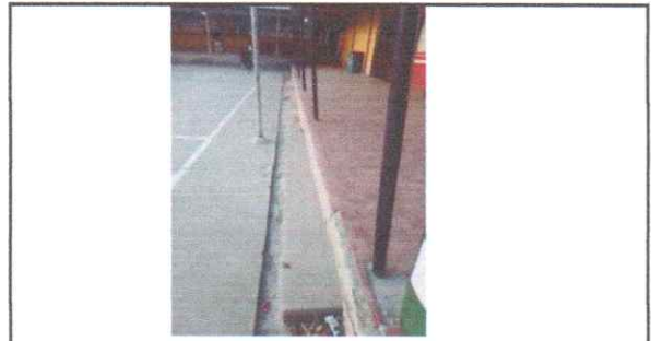
REPARACIÓN/SUSTITUCION/MANTENIMIENTO PISO Reparación de filo en piso antideslizante existente