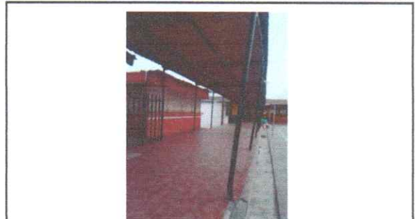
REPARACIÓN ESTRUCTURA PORTANTE DE TECHO EN PASILLO Mantenimiento a estructura de soporte de metal con anticorrosivo Sustitución de tubo cuadrado de 1 1/4"