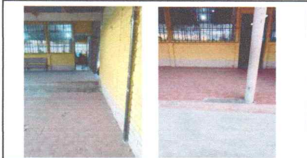
REPARACIÓN/SUSTITUCIÓN/MANTENIMIENTO PISO Sustitución dos rampas de concreto (incluye barandal en cada rampa con tubo redondo de 1 1/4") una de 2.50m x 1.40m y otra de 1.25m x 1.40m)