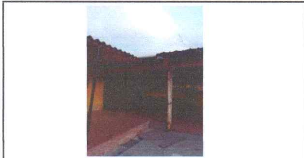
REPARACIÓN ESTRUCTURA PORTANTE DE TECHO EN PASILLO Sustitución de bajada de agua pluvial pvc de 3" en pasillo Sustitución de Canal de metal calibre 26 en pasillo