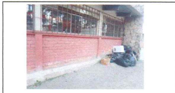
MANTENIMIENTO PINTURA EN MUROS EXTERIORES Reparación de ladrillos dañados