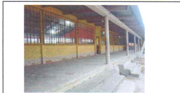
MANTENIMIENTO PINTURA EN MUROS EXTERIORES Aplicación pintura latex para muros exterior

Observación: Si es necesario se pueden agregar Hojas adicionales y actualizar el número de hojas.