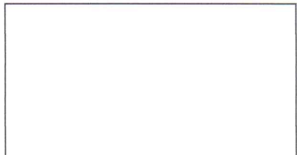
MANTENIMIENTO PINTURA EN MUROS EXTERIORES Aplicación pintura latex para muros exterior

Observación: Si es necesario se pueden agregar hojas adicionales y actualizar el número de hojas.