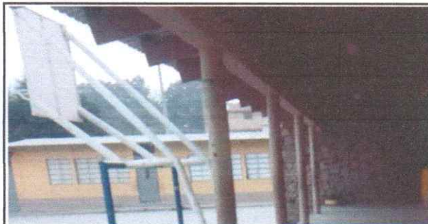
SUSTITUCIÓN DE CABLE DE INTERCOMUNICADOR CON CABLE PARALELO No. 16 ENTUBADO