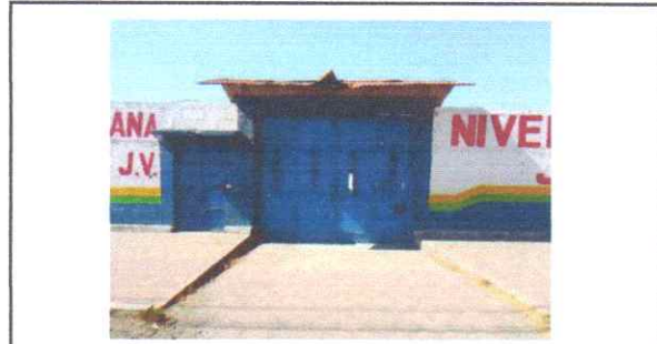
REPARACIÓN/SUSTITUCIÓN/MANTENIMIENTO DE PORTON Y PUERTA PRINCIPAL