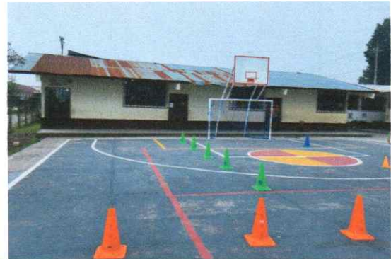
Sustitución de lámina, por lámina troquelada Calibre 26 para aulas

Observación: Si es necesario se pueden agregar hojas adicionales y actualizar el número de hojas.