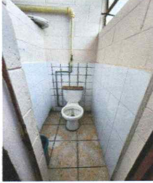
Sustitución de inodoros