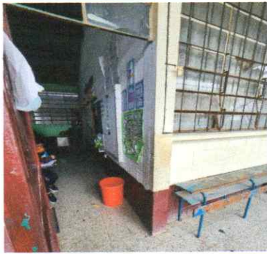
Mantenimiento de estructura de puerta de metal de aula