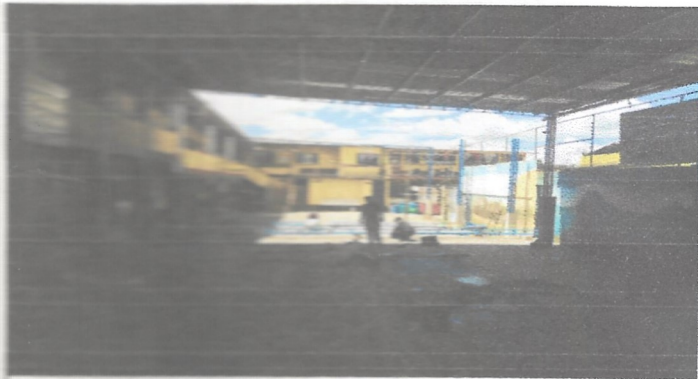
Sustitución de estructura de soporte (madera, metal) por metal