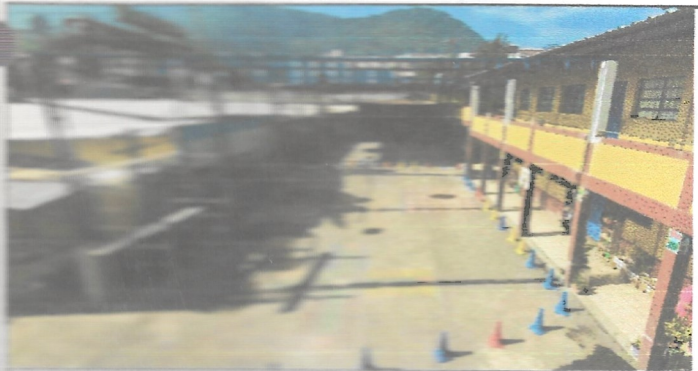
Sustitución de cañerías por tubería tripleada calibre 25