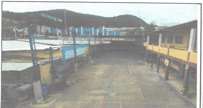
Sustitución de estructura de soporte (madera, metal) por metal