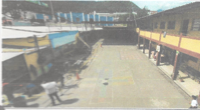
Sustitución de pedregal de concreto de 0.3x0.3x1.0m