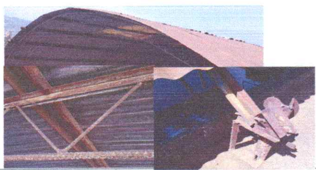
SUMINISTRO E INSTALACIÓN DE ESTRUCTURA METALICA

Observación: Si es necesario se pueden agregar hojas adicionales y actualizar el registro de las fotos.