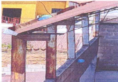
SUMINISTRO DE E INSTALACIÓN DE ESTRUCTURA METALICA