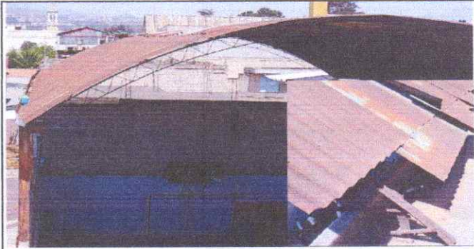
SUSTITUCIÓN E INSTALACIÓN DE LÁMINA ALUZINC CALIBRE 26