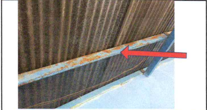
MANTENIMIENTO A ESTRUCTURA DE TECHO DE METAL PINTURA ANTICORROSIVA