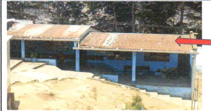
SUMINISTRO, CAMBIO E INSTALACIÓN DE LAMINA TROQUELADA CAL 24