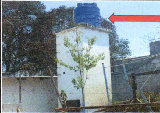
SUMINISTRO, HABILITACIÓN E INSTALACIÓN DE DEPOSITO DE AGUA TRICAPA 2500 L