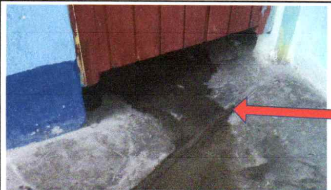
SUMINISTRO E INSTALACION DE ACCESORIOS PARA MEJORAMIENTO Y HABILITACION DE LAVAMANOS, PILAS E INODOROS