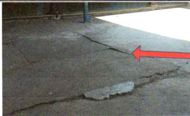
SUMINISTRO, DEMOLICIÓN, CONFORMACIÓN DE BASE Y TORTA DE CONCRETO