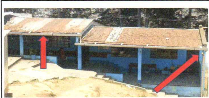
MEJORAMIENTO DE CANALES Y BAJADAS DE AGUA