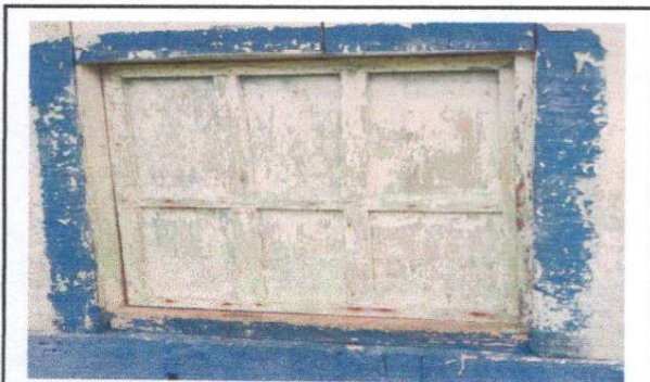
Foto 5: 5.3 Sustitución de ventana de madera por metal mas vidrio