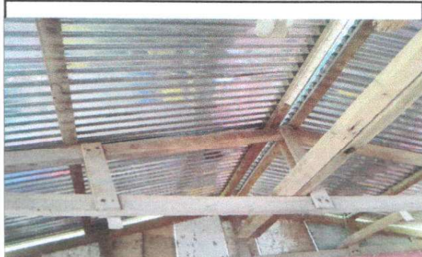
Foto 2: 5.2 Sustitución de capote de lamina para lamina troquelada.