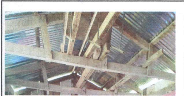
Foto 3: 2.2 Sustitución de estructura de soporte de madera por metal