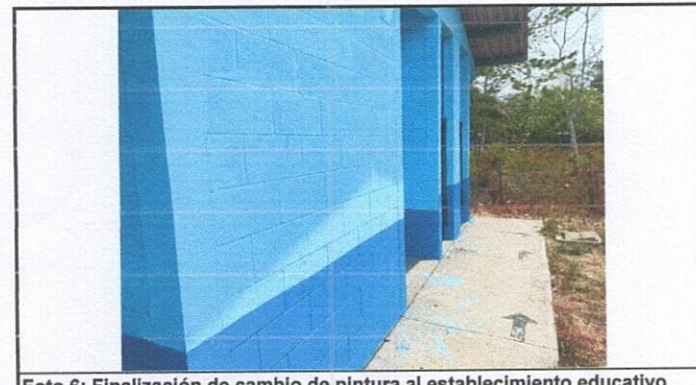
Foto 6: Finalización de cambio de pintura al establecimiento educativo

Observación: Si es necesario se pueden agregar hojas adicionales y actualizar el número de hojas.