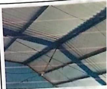
Mantenimiento de soporte de estructura de metal