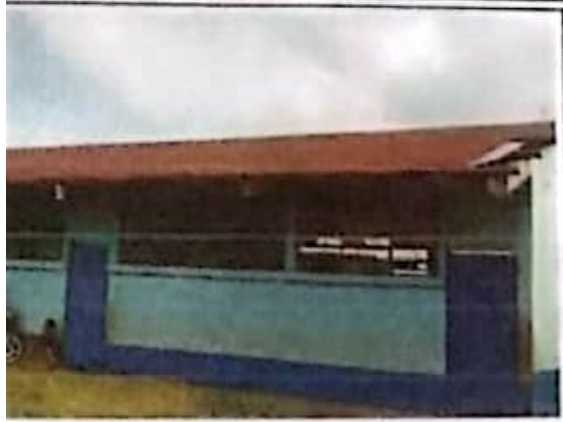
por lamina traquilada