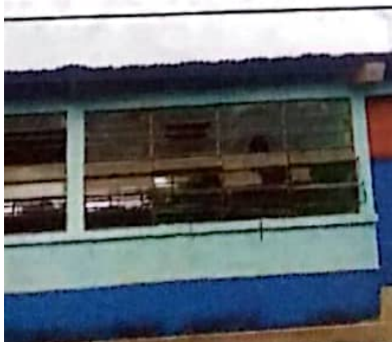
de metal de ventana