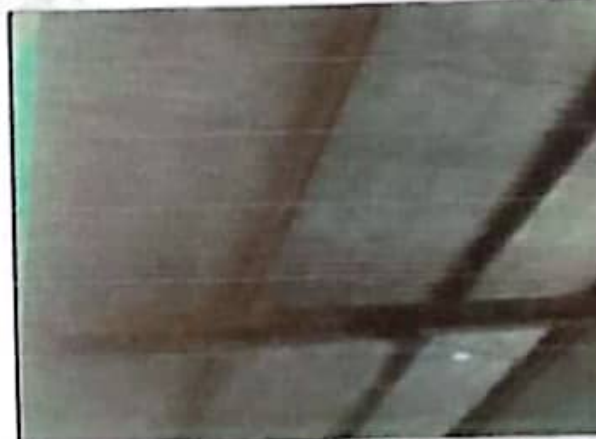
Mantenimiento de soporte de estructura de metal.