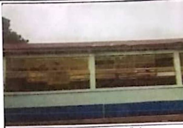
Sustitución de lámina por lámina traquilada