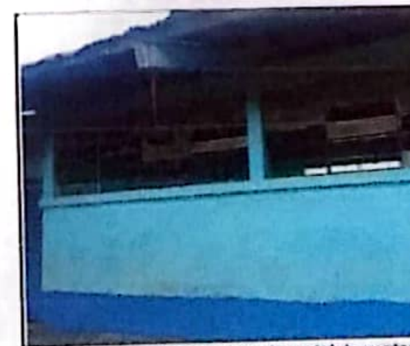
Mantenimiento de estructura de metal de ventan

den agr... hojas adicionales... finalizar el número de hojas.