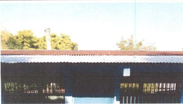
Foto1: sustición de lamina por lamina troquelada aluzinc calibre 26