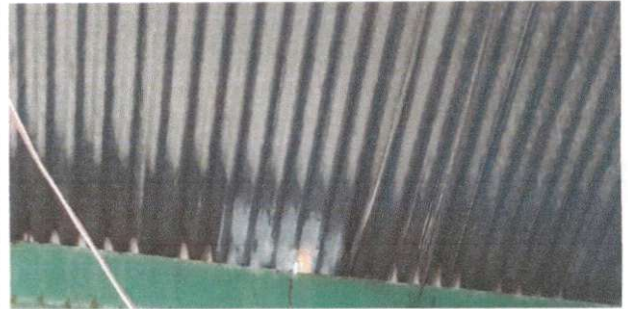
Foto 2: sustición de lamina por lamina troquelada aluzinc calibre 26