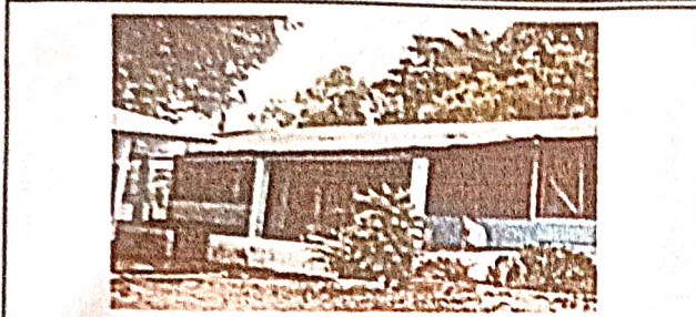
Foto 1: Sustitución de lámina por lámina troquelada aluzinc calibre 26.