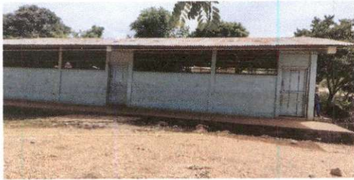
Foto 3: Sustitucion de lamina por lamina troquelada de aluzinc (aula 1)