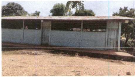
Foto7: Pintura en muros exteriores e interiores ( aula 1 y 2)