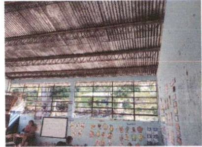
Foto 2: Sustitucion de estructura de soporte de metal por metal (Aula 2)