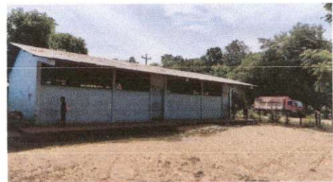
Foto 4: Sustitución de lamina por lamina troquelada de aluzinc (aula 2)