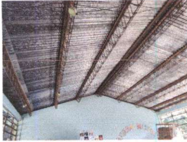
Foto1: Sustitucion de estructura de soporte de metal por metal (Aula 1)