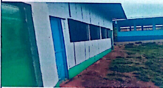
SUSTITUCIÓN DE ESTRUCTURA DE SOPORTE DE MADERA, POR METAL

Observación: Si es necesario se pueden agregar hojas adicionales y actualizar al número de hojas.