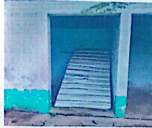
FABRICACION E INSTALACION DE PUERTAS DE METAL EN BAÑOS