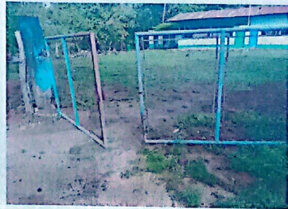
MANTENIMIENTO EN PORTON DE METAL