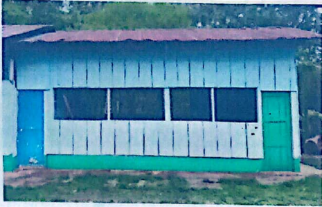
SUSTITUCIÓN DE LAMINA, POR LAMINA TROQUELADA ALUZINC CALIBRE 26