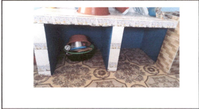
MANTENIMIENTO EN ESTUFA RURAL