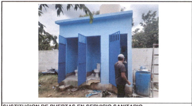
SUSTITUCION DE PUERTAS EN SERVICIO SANITARIO

Observación: Si es necesario se pueden agregar hojas adicionales y actualizar el número de hojas.