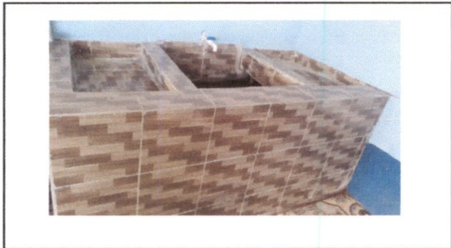
SUSTITUCIÓN DE PILA DE CONCRETO 2 LAVADEROS