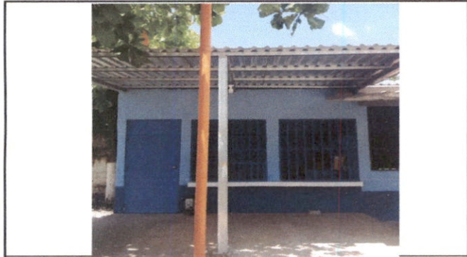
REPARACIÓN DE MURO DE CONTENCIÓN