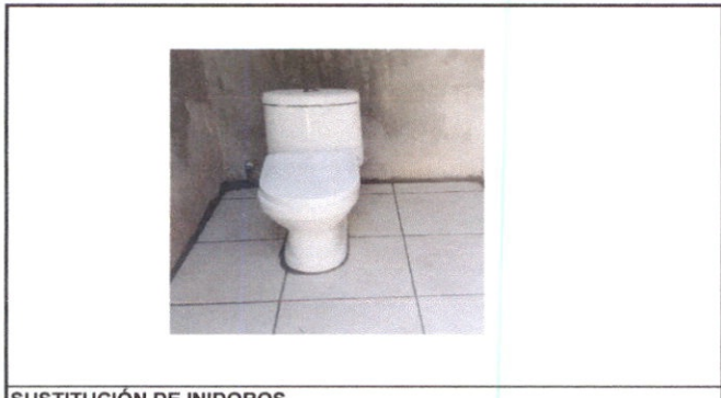
SUSTITUCIÓN DE INIDOROS